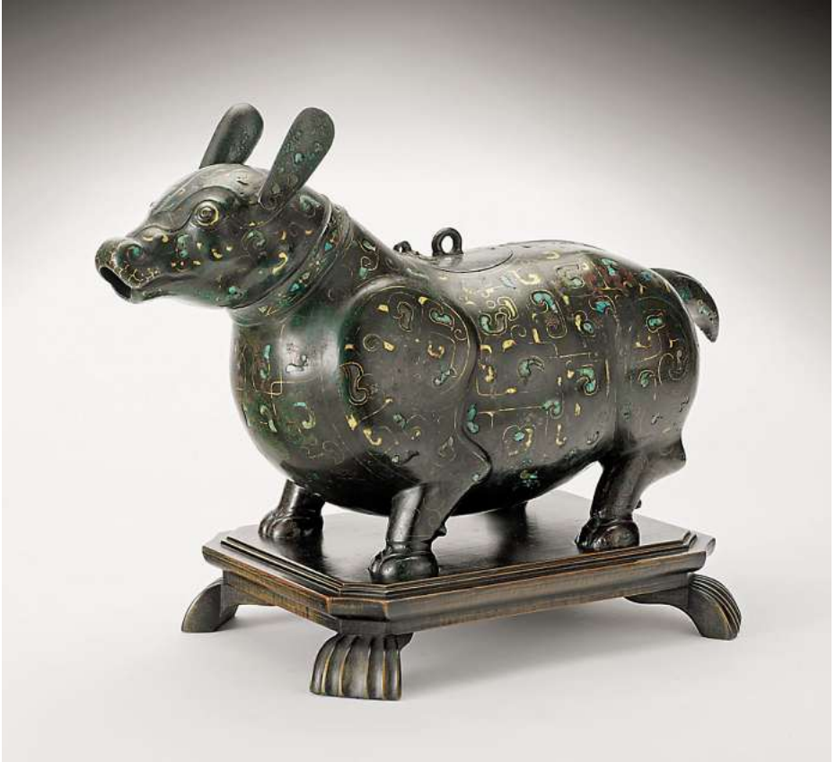
Kultgefäß in der Form eines Opferrindes, China, wohl erste Jahrhunderte nach Chr. Rote Bronze goldtauschiert und mit Türkisen eingelegt. Provenienz: Sammlung G.F. Reber, Lausanne 1930. Literatur: Otto Kummel, Chinesische Kunst, Berlin 1929, S. 198, Nr. 496 (inkl. Abb.). Verkauft im November 2006 für CHF 500'000 (EUR 322'600, USD 400'000)