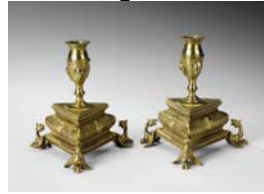
Abbildung bezeichnet als 3785.

3784 | Paar Kerzenleuchter, Régence-Stil