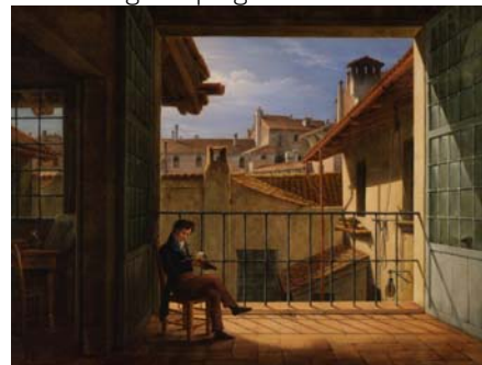
Abbildung ist spiegelverkehrt

1191 CARL CHRISTIAN CONSTANTIN HANSEN: Junger Künstler in seinem Atelier über den Dächern Roms