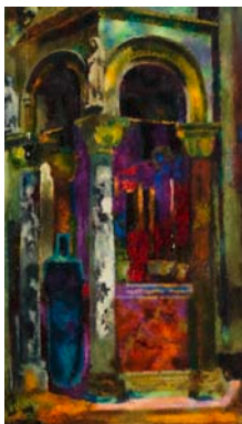
AUGUSTO GIACOMETTI Stampa 1877-1947 Zürich

Zuschlag (inkl. Aufgeld): CHF 2'315'000 | EUR 1'929'167