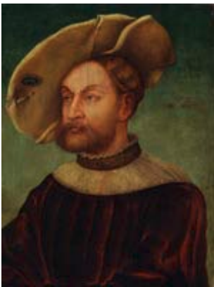
JÖRG BREU D.Ä. Augsburg um 1475-1537 Augsburg

Zuschlag (inkl. Aufgeld): CHF 60'000 | EUR 50'000