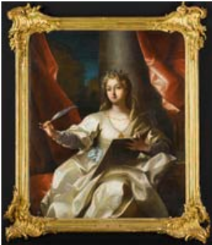
JEAN RAOUX Montpellier 1677-1734 Paris