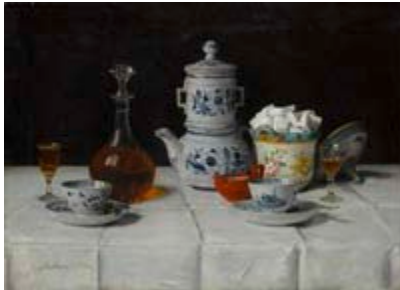
ALBERT ANKER Ins 1831-1910 Ins