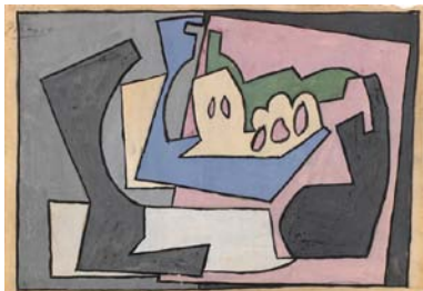
PABLO PICASSO Malaga 1881-1973 Mougins