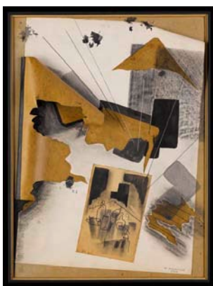
YURI (ZHORZH) PAVLOVICH ANNEKOV Petropavlovsk-on-Kamchatka 1889-1974 Paris

Zuschlag (inkl. Aufgeld): CHF 498'000 | EUR 415'000